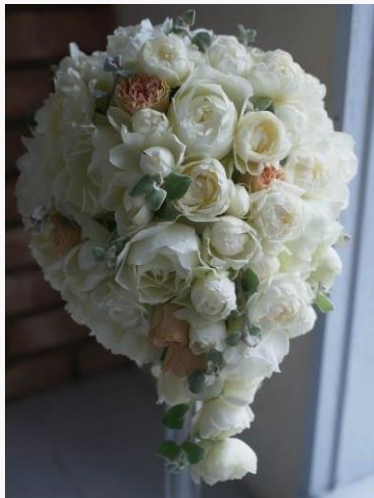
price 33,000yen~ ティアドロップブーケ