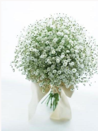
price 22,000yen~33,000yen カスミ草のクラッチブーケ