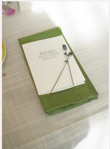
price 220yen ナフキンフラワー