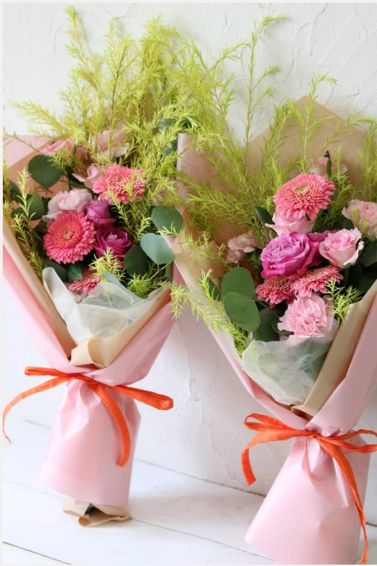
price 5,500yen~11,000yen 両親贈呈用花束