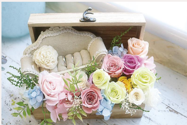
price 11,000yen リングピロー