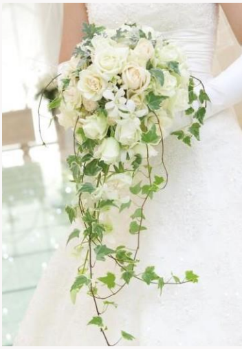
price 33,000yen~55,000yen カスケードブーケ