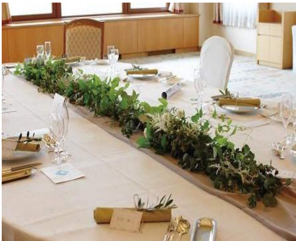
1 m ガーランドグリーンミックス+花 price 11,000yen