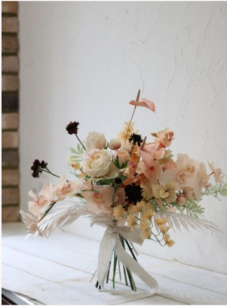
price 33,000yen~44,000yen アーティフィシャルブーケ