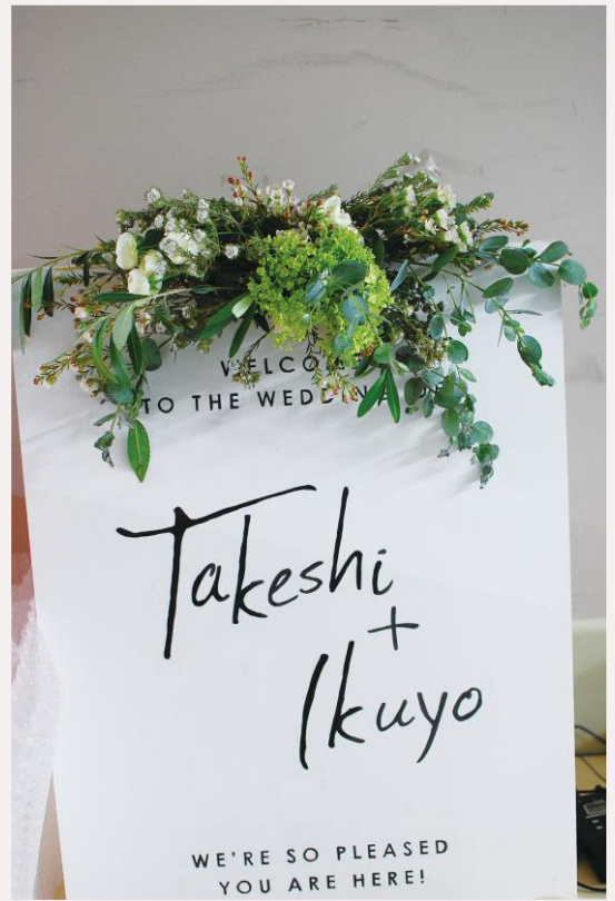
price 5,500yen~ ウェルカムフラワー