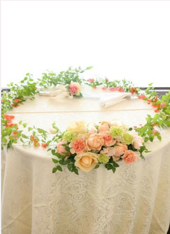
アレンジ+グリーン+花びら +ナイフ装花 price 16,500yen