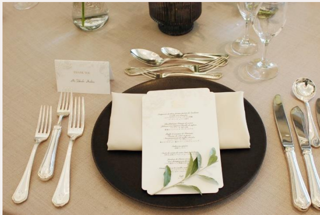
price 110yen ナフキングリーン