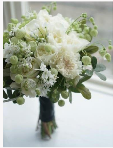
price 27,500yen~44,000yen クラッチブーケ