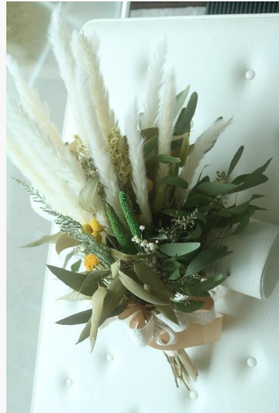
price 27,000yen~32,000yen ドライブーケ