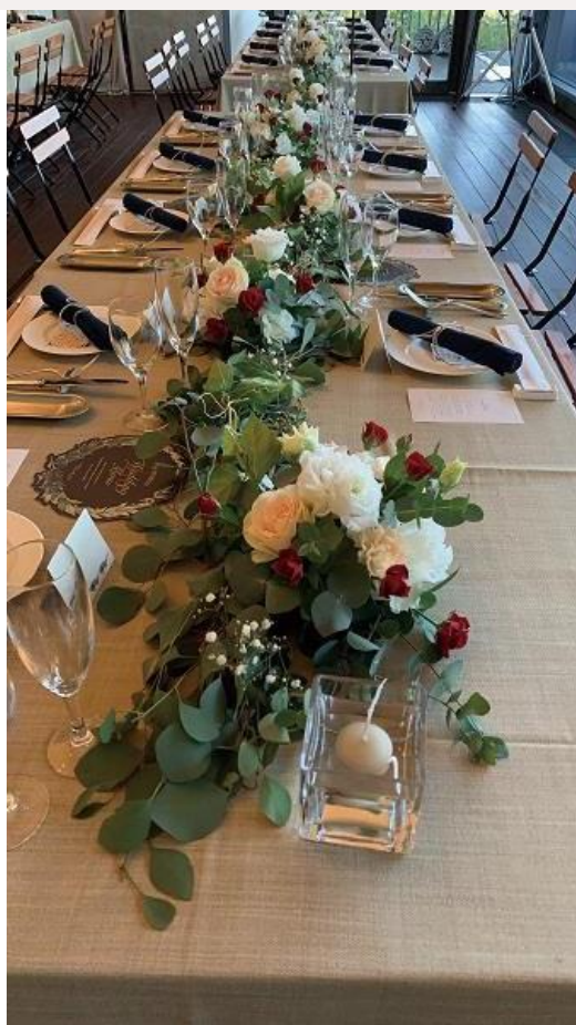
1 m ガーランド+ アレンジ5,500円2個+ フローティング2個+ カスミ草 price 15,400yen