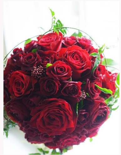
price 33,000yen~44,000yen ラウンドブーケ