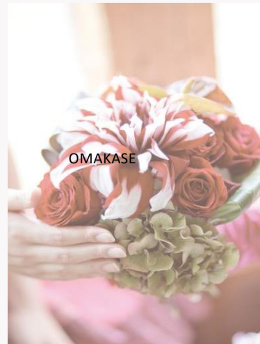
price 22,000yen デザイナーおまかせブーケ