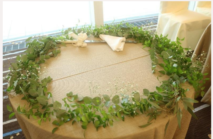
グリーン+花びら+ナイフ装花 price 11,000yen